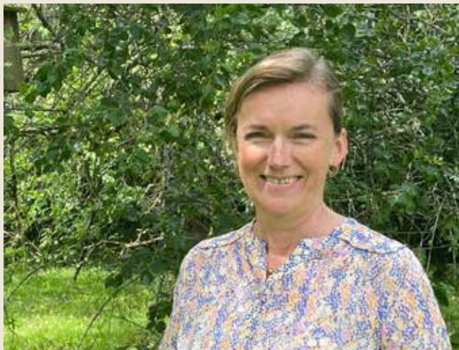
Denne fælleseftermiddag byder vores sognepræst på sine yndlingsange krydret med små fortællinger.